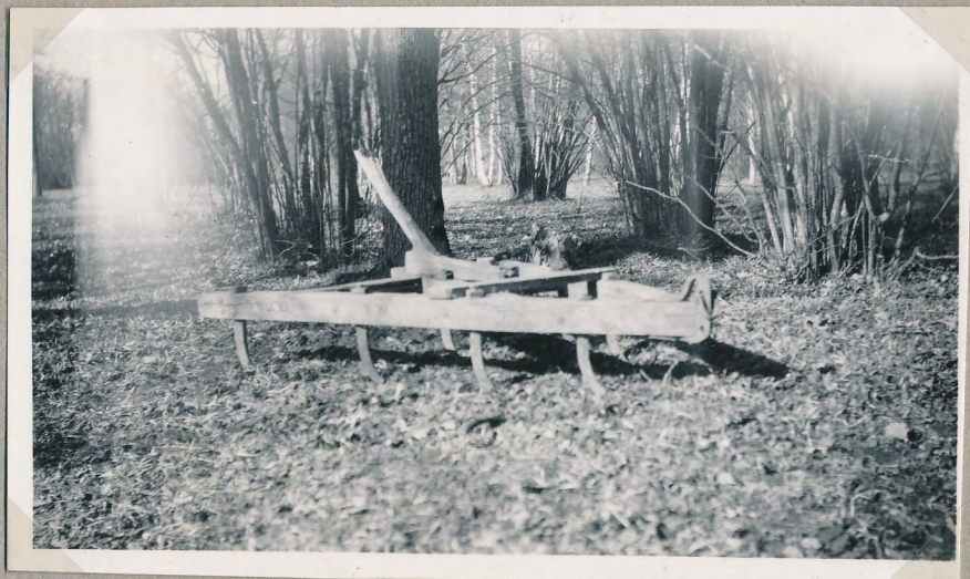
Film nr 6394