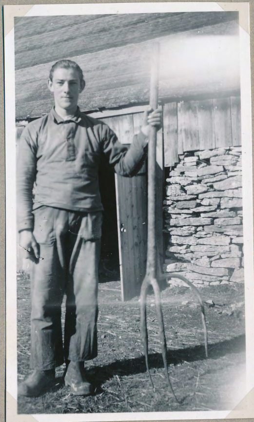
Film nr 6398 9