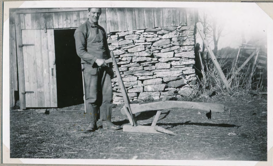
Film nr 6397