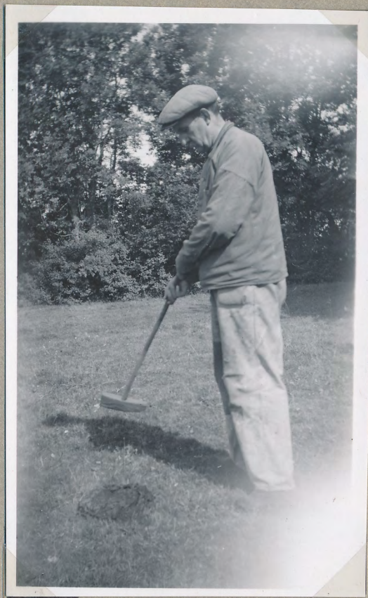
Film nr 6399 10