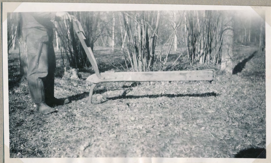
Film nr 6386