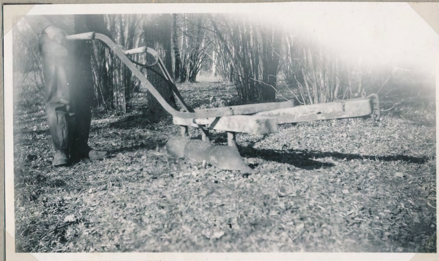
Film nr 6393