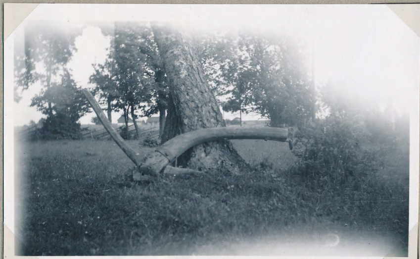
Film nr 6400 11