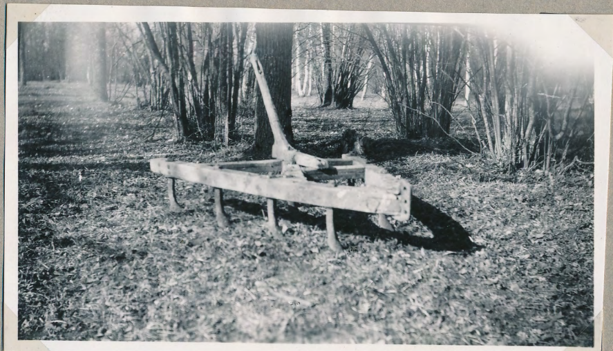
Film nr 6395